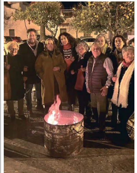
Zambomba celebrada el pasado año en María Auxiliadora.