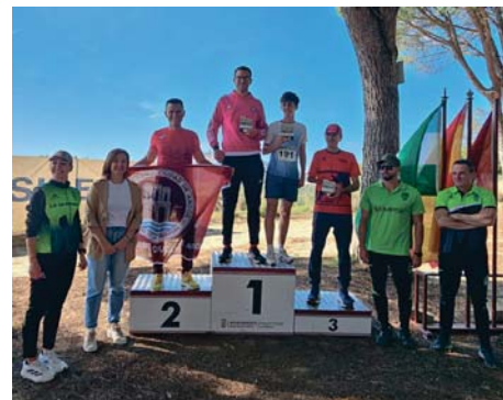
La entrega de diplomas duró más que la carrera en sí debido a la cantidad de podios que celebrar con tantas categorías. AYUNTAMIENTO