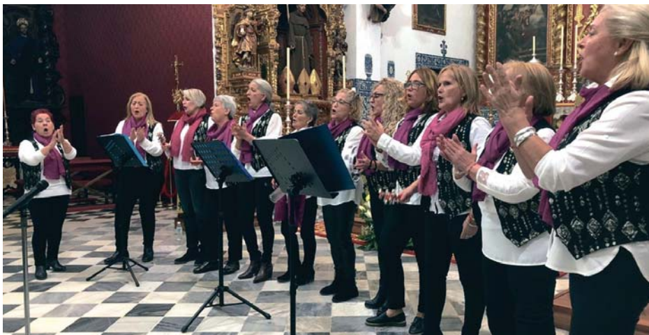
Entre las actividades de las hermandades, destaca el décimo aniversario del Certamen de Villancicos de San Antonio. MACÍAS