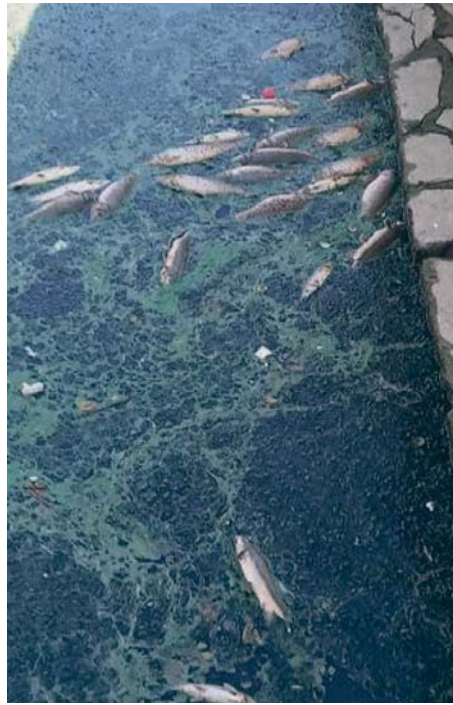
Peces muertos junto al azud de San Antón.

fondo del río de un grosor, según sus cálculos, superior a un metro. Además, sostienen que se está produciendo eutrofización en una amplia zona del azud, es decir, la aparición de una capa de algas que impide la entrada de luz solar y agota la producción de oxígeno, coadyuvando a la mor-