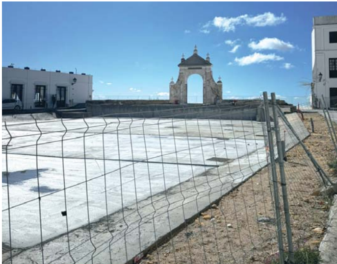
Estado actual de la Plaza del Cabildo, que sigue esperando una actuación para su terminación.