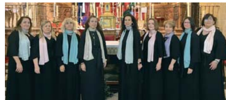
La coral arcense da fe una vez más de su calidad.