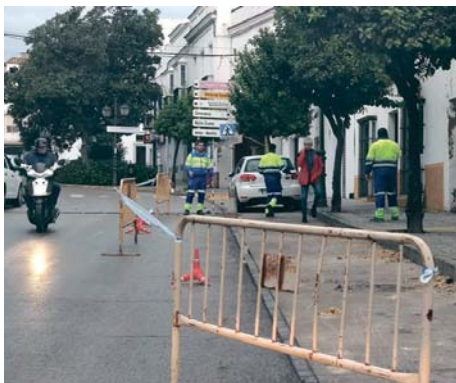
Nuevo socavón en pleno centro urbano de Arcos. MACÍAS

Lo más llamativo, no obstante, es el nuevo problema urbanístico en pleno centro de la ciudad, pues se ha comprobado la existencia de un nuevo socavón en la calle Alameda, cerca de donde hace unas semanas se produjo otro, en este caso en la calle Pérez del Álamo. En la tarde del miércoles la Policía Local comenzó a evacuar la zona de vehículos en previsión de un posible hundimiento. Ya en la mañana del jueves, los técnicos municipales supervisaron el lugar que ya ha sido precintado por razones de seguridad, y ya opera en la zona una empresa contratada a tal