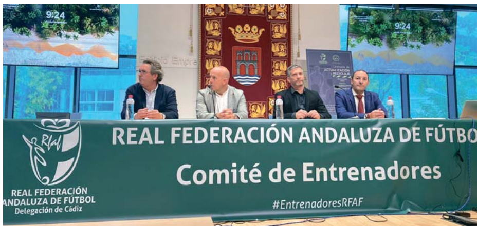
La jornada convocada por la Real Federación Andaluza de Fútbol a través de la delegación de Cádiz se celebró en el edificio Emprendedores. AVTO.