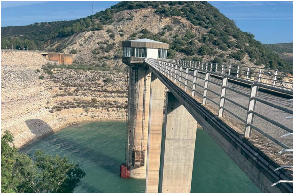
Así se encuentra en estos momentos el pantano más grande de la cuenca y del término de Arcos, el de Guadalcazín. PILAR BENÍTEZ A.

MEDIO AMBIENTE El pantano de Arcos estaba ayer casi al 94 por ciento y no se descartan nuevos desembalses