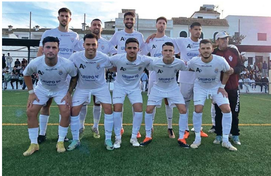
El conjunto local realizó varias rotaciones y mostró una alineación distinta a la de convocatorias anteriores. ARCOS C.F.

De cara a la próxima jornada, la décima ya, el Arcos viajará hasta San Fernando para medirse al Grupo de Empresas Bazán C.F. A tenor del último resultado, el Arcos seguirá con doce puntos en la clasificación tras haber perdido cinco partidos y ganado cuatro. Tiene 14 goles en contra y 12 a favor.