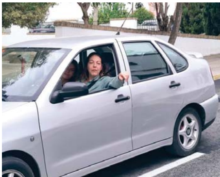
Primer vehículo en cruzar la calle Perú tras su reapertura. MACÍAS

Se trata, en suma, de otra de las intervenciones, en este caso con una inversión de 162.000 euros, que el Ayuntamiento desarrolla a la luz de un plan para mejorar las infraestructuras del agua, y que se suma a las ejecutadas en calles como Jabonería o Alejo