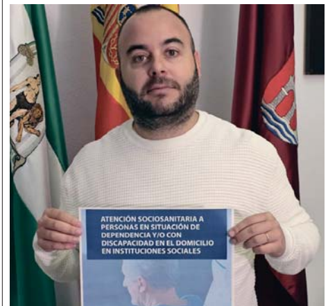
El delegado de Juventud anima a la inscripción. AYUNTAMIENTO

ARCOS | La Delegación municipal de Juventud anuncia un nuevo curso. Se trata de un proceso formativo sobre ayuda domiciliaria a personas en situación de dependencia. La inscripción se abre la próxima semana se forma presencial en la misma Delegación, en la Casa de la Juventud ‘Antonio Her-