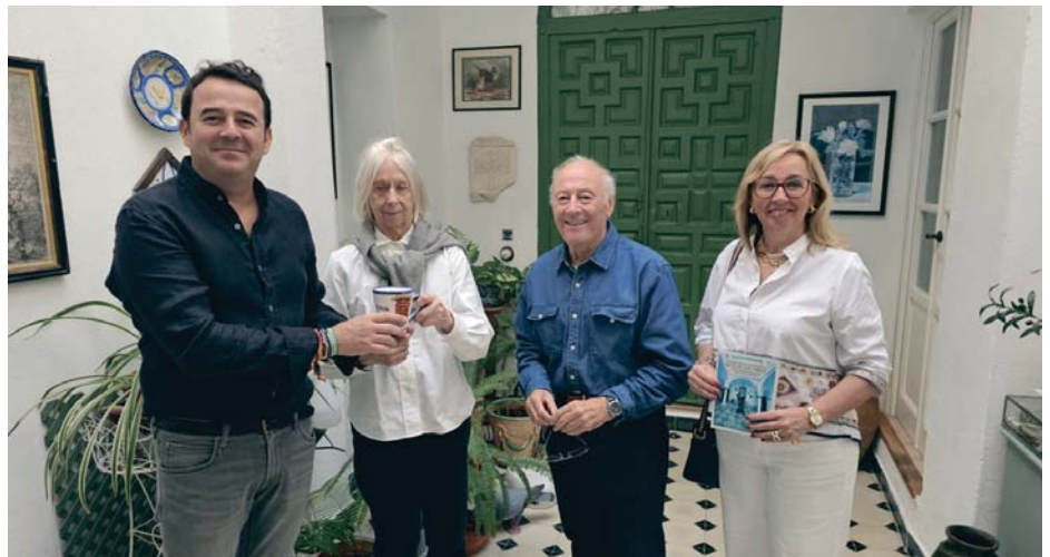
Los vecinos y vecinas de Arcos abrieron las puertas de sus viviendas para mostrar sus magníficos patios.