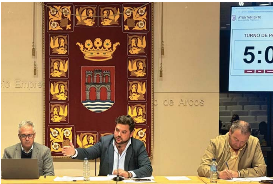
El Pleno celebró su última sesión de 2024 con carácter ordinario para aprobar, entre otros, un acuerdo laboral con la plantilla municipal. AITO.

ORDEN DEL DÍA También se aprueba la ampliación del servicio de salas de estudio