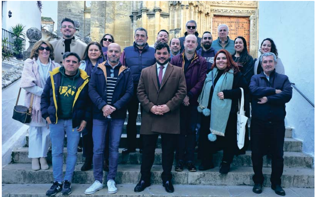
Autoridades y medios de comunicación se fotografiaron en las escalinatas de la Basilica Menor de Santa María tras un agradable desayuno de convivencia.

En fiestas, Arcos ha gozado a lo largo del año de una programación estable, con el Carnaval en los barrios, las “exitosas” precampanadas de fin de año en el Barrio Bajo y otras actividades que pasan por la recuperación de la zambomba con vistas a futuras generaciones. El balance hace hincapié además en cuatro campañas para el fomento de