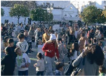
Los niños fueron protagonistas en primer lugar en las precampanadas de fin de año en el Barrio Bajo. RAMÓN SERRANO

tos de la cabalgata de Reyes Magos del próximo domingo.