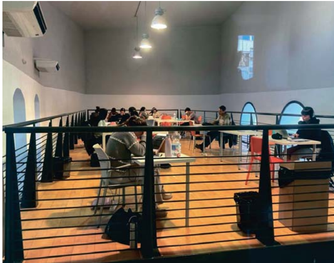
En la imagen, el centro de estudios de la antigua Casa de los Paletos, en la calle Alameda.

“Esto no solo refleja una falta de ética política del equipo de Gobierno al usar el trabajo de IU sin reconocerlo, sino que vulnera el respeto por los procesos democráti-