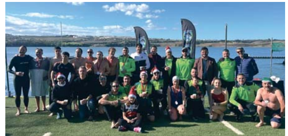
Algunas de las imágenes de las dos divertidas San Silvestre celebradas el pasado fin de semana en la ciudad.