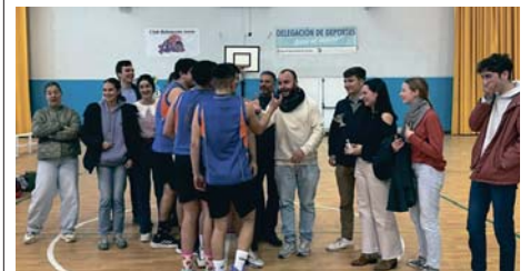
El pabellón acogió los encuentros de baloncesto.