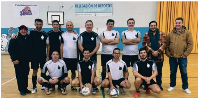
Los periodistas se fotografiaron a las puertas de Santa María y durante el partido en el pabellón. Á. GENAIRO

cos. Una vez finalizado el partido, el grupo se trasladó en un tren turístico hasta el centro de la localidad, donde se dividió en dos gru-